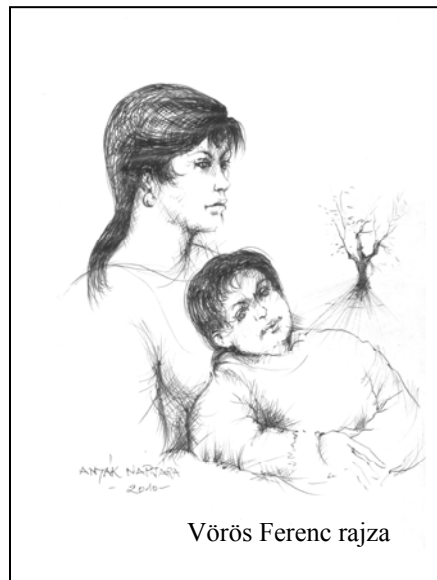
Vörös Ferenc rajza

szülő. Általában aki képes arra, hogy saját önszületett gyermekének beadja a csukamájolajat, azt a csúszós, szörnyű, kibíratatlan ízű kotyvalékot, az nem is lehet anya. Az csak szülő lehet.