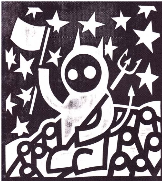
Ördög a Holdon

Lebbentsd a sötét fátlyat feljebb, édes borzongás járja át majd lelked, s az éjszaka virágának csodaszép kelyhét megeled.