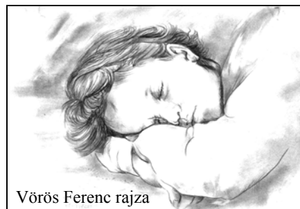
Vörös Ferenc rajza

A lelkem is dalolt, de álompor hullott a szemembe. S ahogy a tájat ellepte az este, megváltozott a világ. A szendergő éjjeli sötétben szirmokat bontott a boldogságvirág.