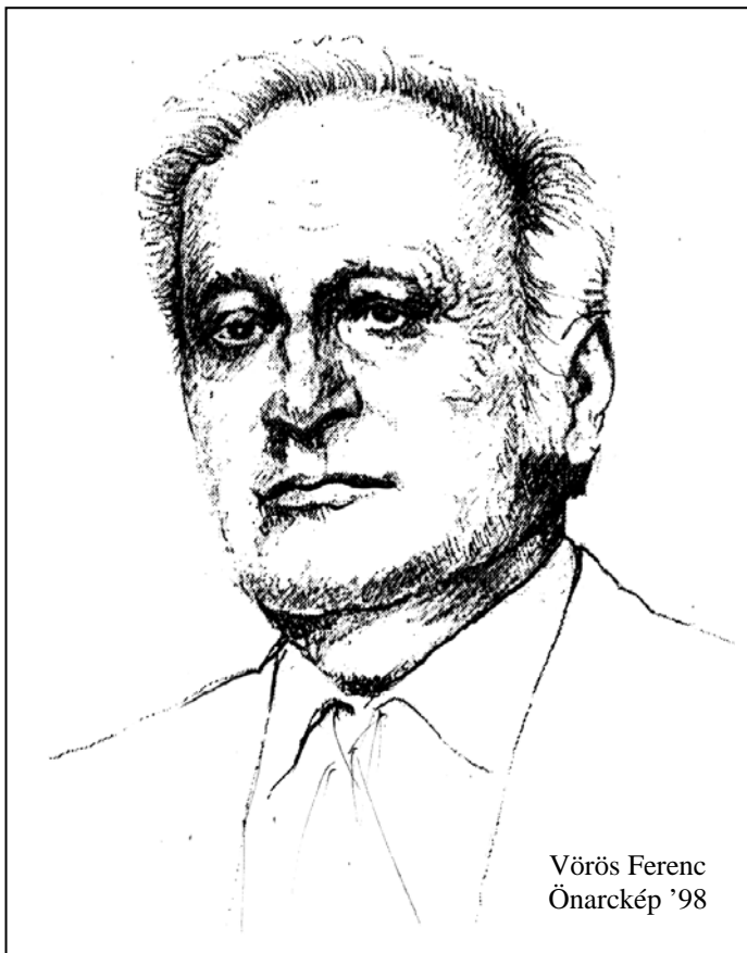
Vörös Ferenc Önarckép '98

Felh rejt fázó csillagot, nyújtózkodnak az éjek, és kurtábbak a nappalok, egy messzi jászol úgy ragyog, hogy színe lesz az égnek.